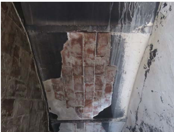
Poškozená konstrukce stávajícího SDK podhledu nad 3.NP