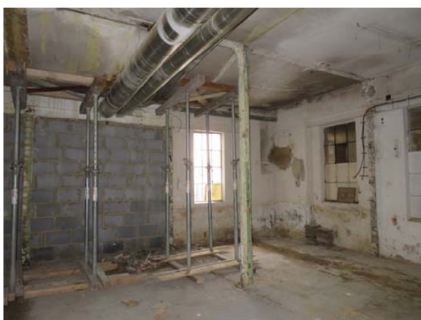
Obnažené a poškozené stropní trámy nad 1.NP – po vybourání betonové desky – rozepření spodní příruby zajištěno ocelovými profily navařenými v sousedním poli na spodní hranu I 400