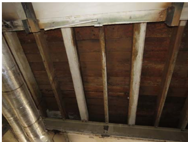
Chybějící podlaha stropu nad 1.NP