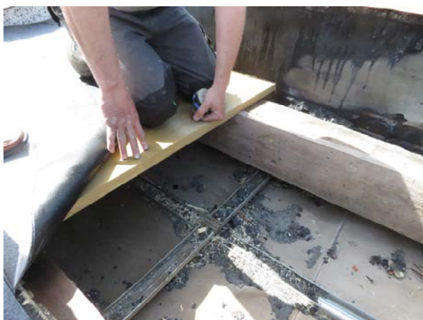
Poškozená podlaha v 3.NP