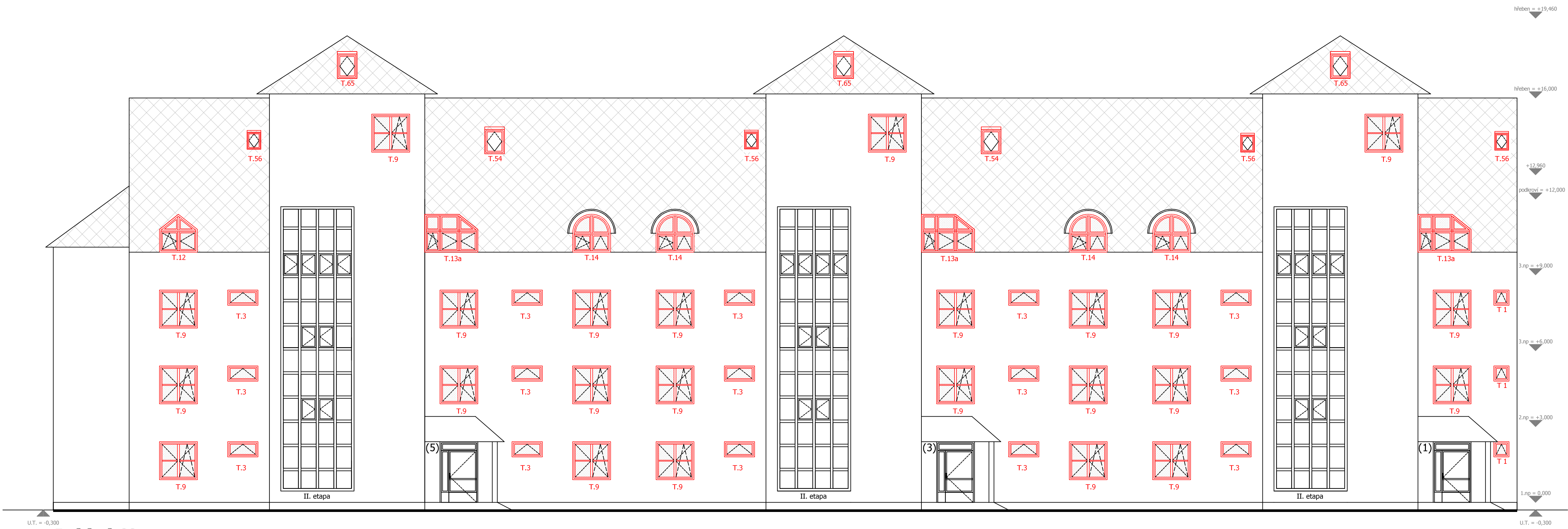
Pohled C2 (dvorní)